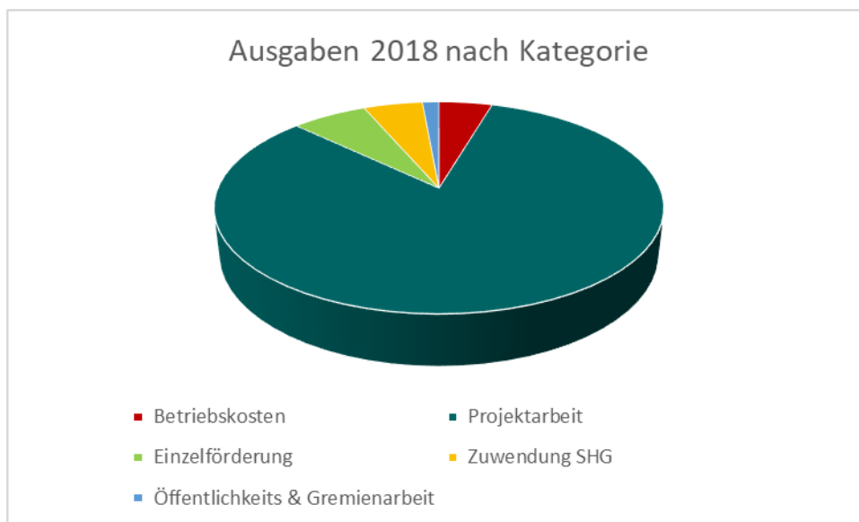
Abb. 1 (oben) Tabelle 1 (unten): Kosten nach Kategorie

Im Jahr 2018 hat die Stiftung taubblind leben insgesamt 130.977,76 € ausgegeben. Die Ausgaben der Stiftung verteilen sich wie in Abbildung 1 und Tabelle 1 gezeigt.